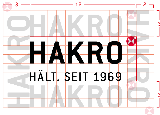
Die Schutzzone entspricht der Höhe des HAKRO-Logos.